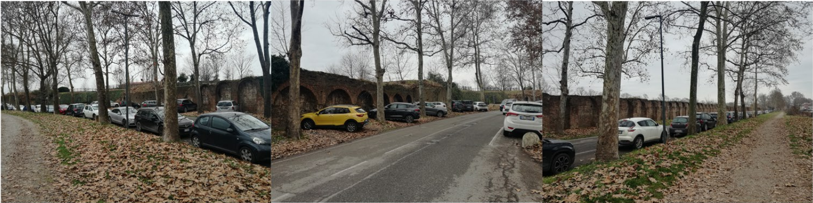
Situazione attuale della zona in cui si propone lo spostamento dell'accesso al parcheggio