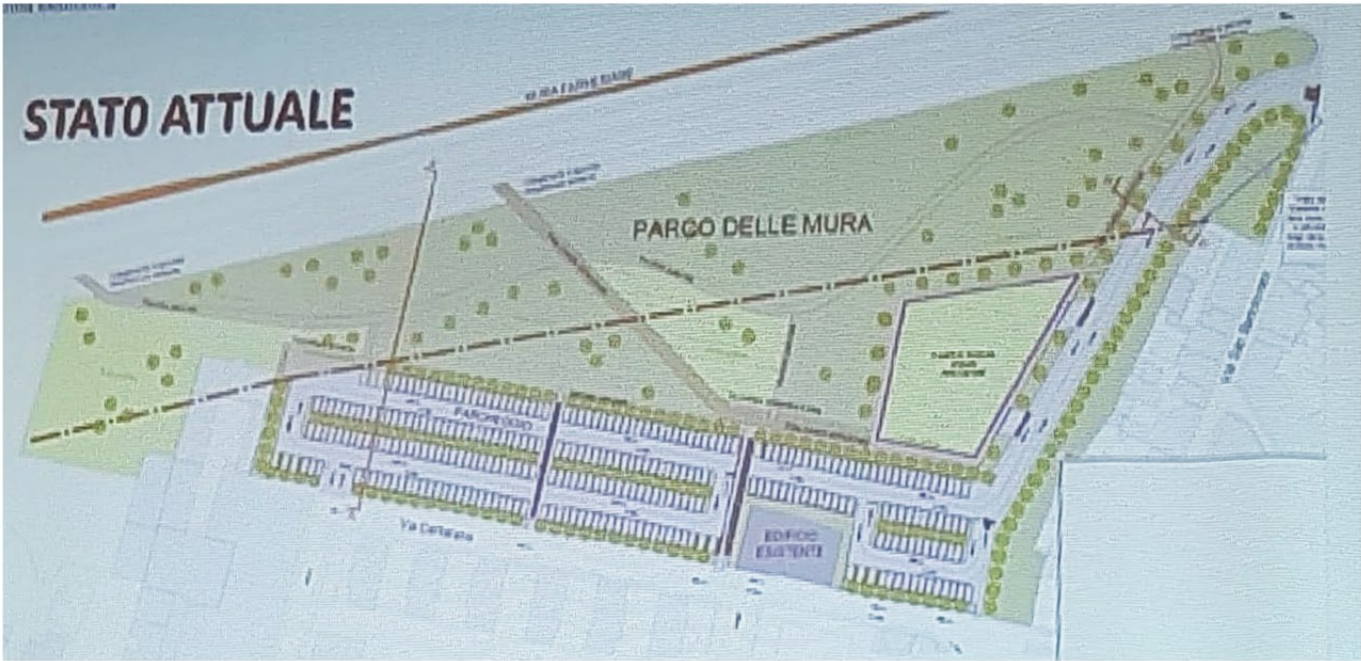
Stato progetto. (Comune di Piacenza)